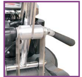
可調式高低調整桿