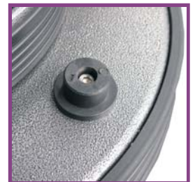
加重器固定鈕 (加重器-選購)